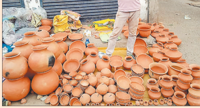
बिक्री के लिए रखे मिट्टी के दिवो।

चैत्र नवरात्र की शुरुआत होने के साथ ही देवी मंदिरों एवं आस्था केन्द्रों में काफी संख्या में उद्योति कलश के साथ हजारों की संख्या में मनोकामना दीप प्रज्वलित होंगे। एमसीबी जिले के खड़गावां के निकट वाम चनवारीडांड स्थित मां महामाया मंदिर में प्रतिवर्ष की भांति इस वर्ष भी हजारों की संख्या में मनोकामना दीप जलाए जाएंगे, जिससे कि देवी मंदिर हजारों दीपों से जगमगा होंगे।