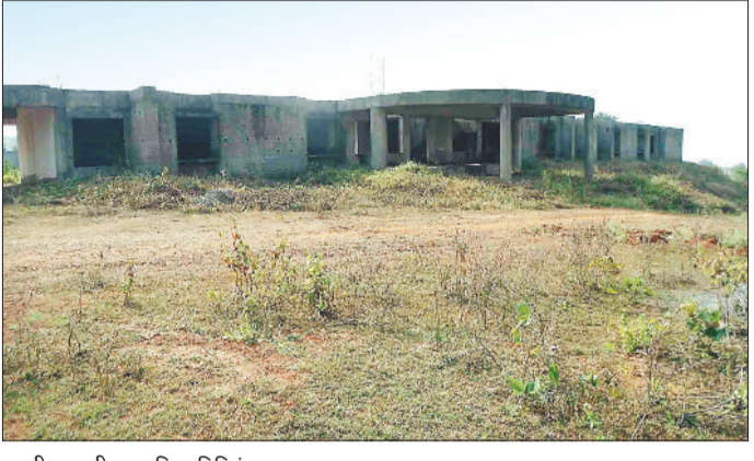
अधी-अधुरी एकडमिक बिल्डिंग।

सालों की मशक्कत के बाद शासन ने संत गिरि गुरु विवि के शैक्षिक गतिविधियों में विस्तार के लिए 25 नए विषयों की कक्षाएं प्रारंभ करने की अनुमति दे दी है लेकिन भवन के अभाव में शैक्षणिक विभागों का विस्तार किसी चुनौती से कम नहीं है। वर्ष 2008 में तत्कालीन सरगुजा विवि की स्थापना होने के बाद प्रबंधन द्वारा वर्ष 2008 में शैक्षणिक विभागों का संचालन प्रारंभ किया गया था। गुरुघासी दास विवि द्वारा शैक्षणिक विभाग अंतर्गत संचालित फार्मसी विभाग के साथ ही प्रयोजन मूलक हिन्दी, लॉ, फार्म एण्ड फेरिस्ट्री, कम्प्यूटर साइंस, बायोटेक्नॉलाजी प्यावरण आदि विभागों का संचालन प्रारंभ किया गया। तब भवन के नाम पर विवि के पास प्रशासनिक कार्यालय संचालन के लिए मात्र एक पुराना शासकीय भवन उपलब्ध था। यूटीडी के विभागों के लिए प्रतीक्षा बस स्टैण्ड के पास निर्मित शासकीय कन्या हायर सेकेण्डरी स्कूल मणपुर का भवन उपलब्ध कराया गया। इसके पूर्व भवन के अभाव में कई बार विभागों का संचालन अलग-अलग शासकीय भवनों में भी किया गया। यूटीडी के वर्तमान भवन में पर्याप्त जगह नहीं होने के कारण कक्षाओं के संचालन में अन्याय