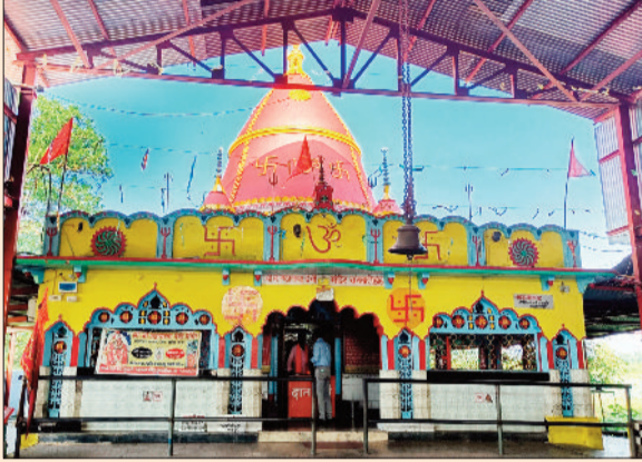
खड़गावां स्थित चनवारीडांड महामाया मंदिर।

के अनुसार इस बार चैत्र नवरात्र 19 मार्च से शुरू होगी तथा इस बार पूरे नौ दिनों तक देवी की आराधना की जाएगी। इस दौरान माता के नौ रूपों की विधि-विधान के साथ पूजा-अर्चना की जाएगी। इस बार का चैत्र नवरात्र में कई शुभ संयोग बन रहे हैं, जो पूजा पाठ एवं धार्मिक कार्यों के लिए बहुत ही फलदायक माने जा रहे हैं।