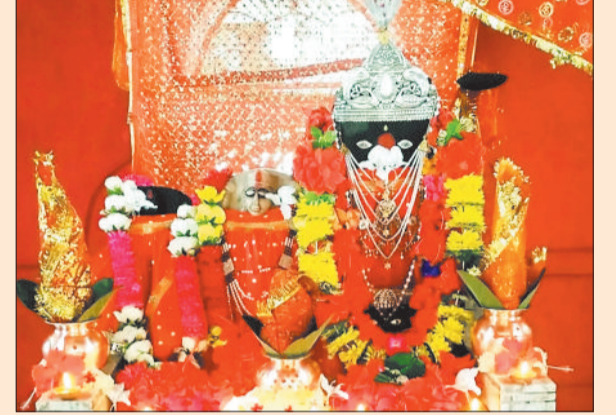
चांग देवी मंदिर जनकपुर।