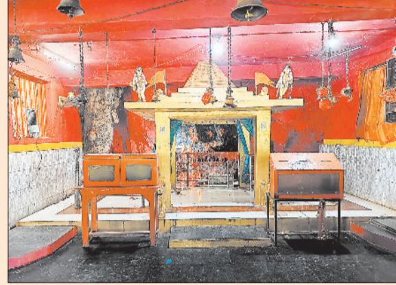
रमदैया धाम मंदिर।